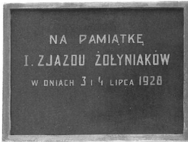
Tablica upamiętniająca I Zjazd, na ścianie żołyńskiego kościoła

Stanisława Dziurzyńskiego oraz sprawozdania z 10-letniej działalności Związku Żołyńców. Wydatki Związku za ten okres zamknęły się kwotą 5956 zł. Uczestnicy Zjazdu udzielili ab-