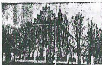
Kościół w Żołyń