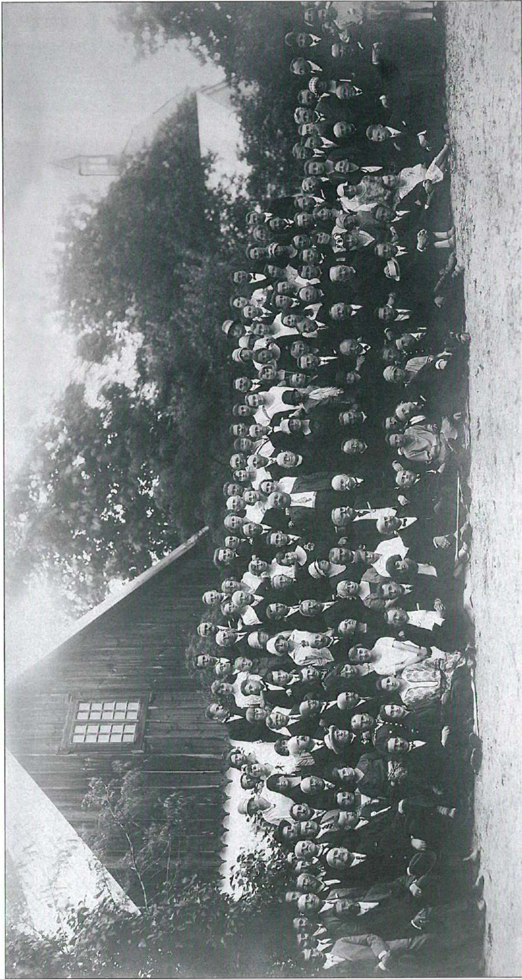
Uczestnicy I Zjazdu Żołyńniaków