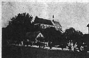
Kościół parafjalny w Żołyńi.