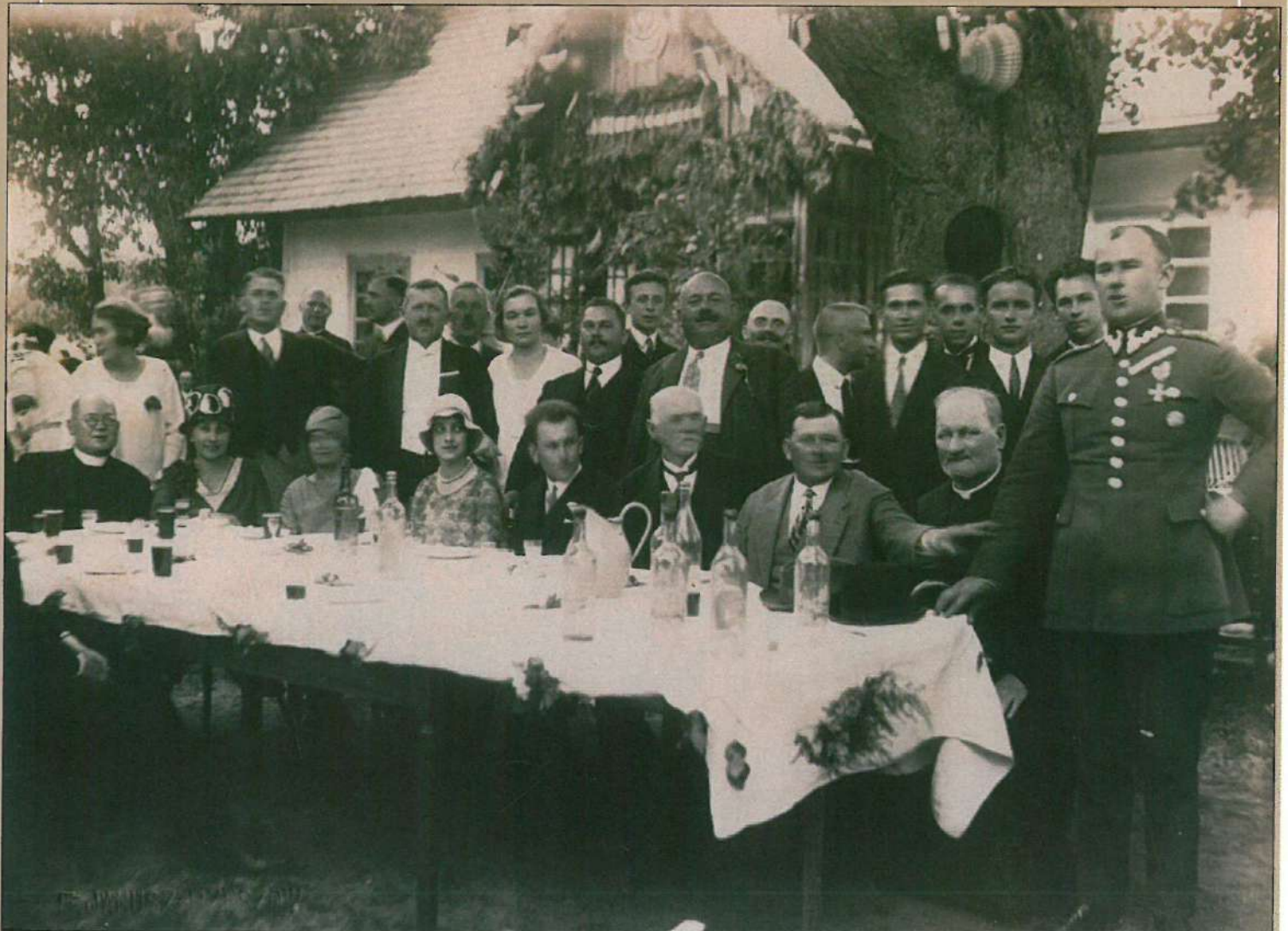
Uczestnicy I Zjazdu przed budynkiem szkoły.