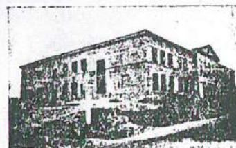
Szkoła w Żołyń