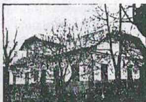
Ochronia w Żołyń