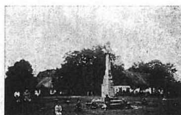
Pomnik Grunwaldzki i Szkoła im. św. Jana Kantego.