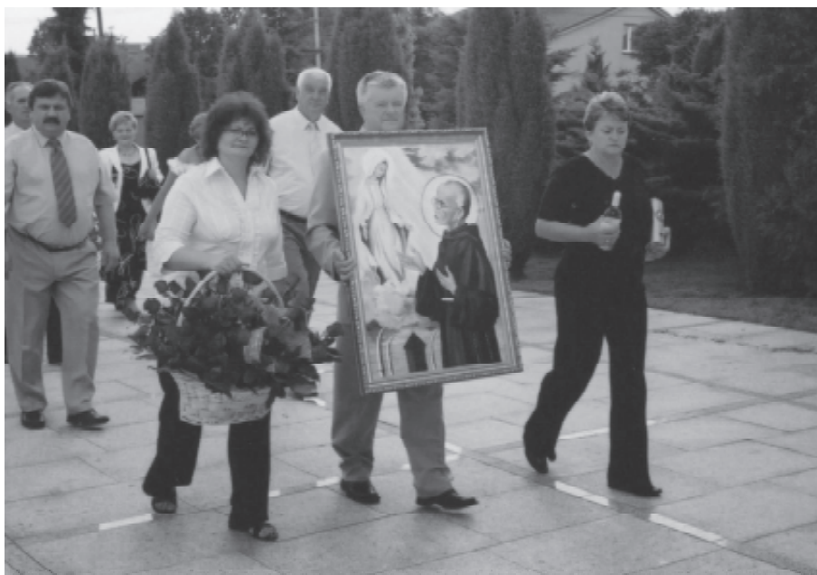
Przedstawiciele zarządu HDK w drodze do kościoła